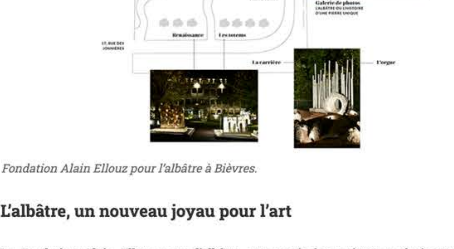
Fondation Alain Ellouz pour l'albâtre à Bièvres.