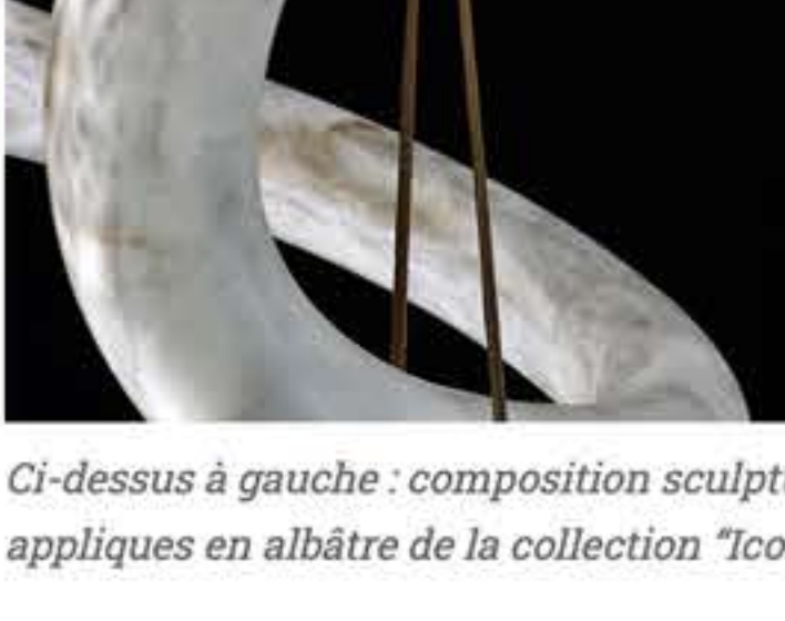
Ci-dessus à gauche : composition sculpturale d'albâtre "Infinity 12". A droite : appliques en albâtre de la collection "Iconic".

Fondation d'entreprise de l'Atelier Alain Ellouz, atelier d'art spécialisé dans les luminaires et les compositions architecturales en albâtre rétro-éclairé, la Fondation Alain Ellouz pour l'albâtre reflète l'ambition affichée par Alain Ellouz, créateur éponyme de l'Atelier, de donner une tribune internationale à l'albâtre dans le monde de l'art.