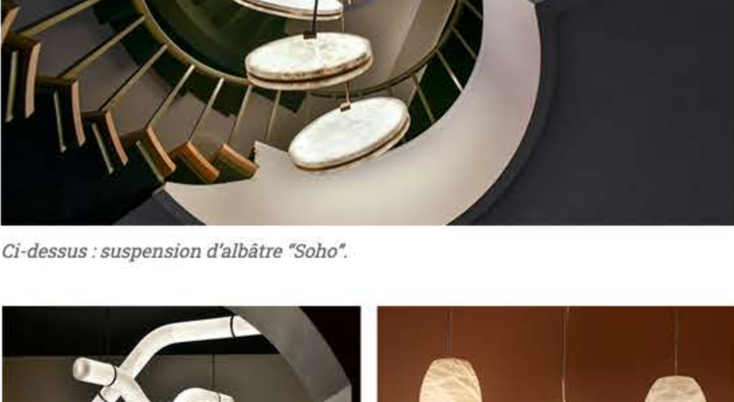
Ci-dessus : suspension d'albâtre "Soho".

Au dernier étage du bâtiment, les terrasses offrent un cadre idéal pour se relaxer et admirer le point de vue magnifique sur le parc.