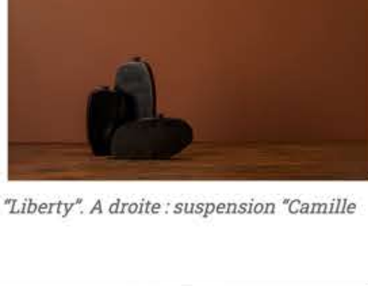
Ci-dessus à gauche : suspension d'albâtre "Liberty". A droite : suspension "Camille Céline Colette".