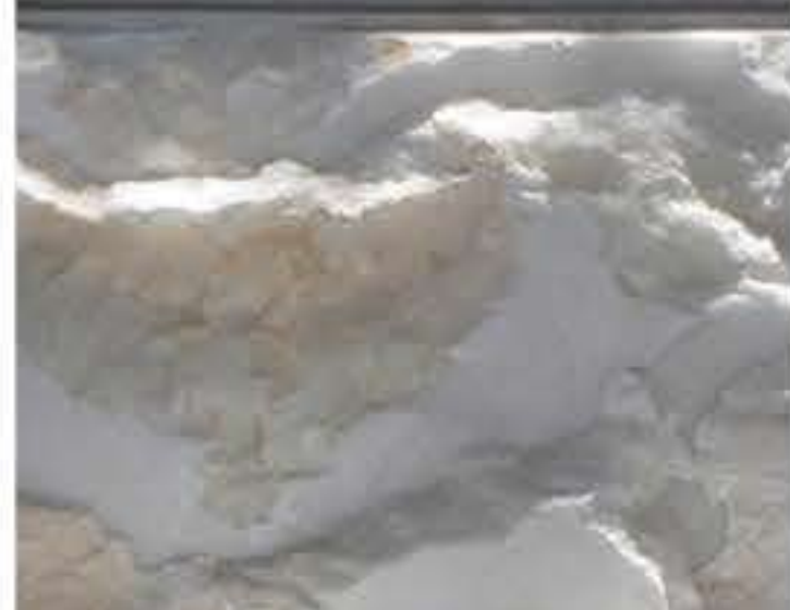
L'albâtre est un caillou terne et d'un blanc laiteux, dissimulé sous les couches d'autres roches à l'état naturel. Au contraire de l'albâtre calcaire, l'albâtre gypseux offre une transparence lui conférant de véritables qualités esthétiques.