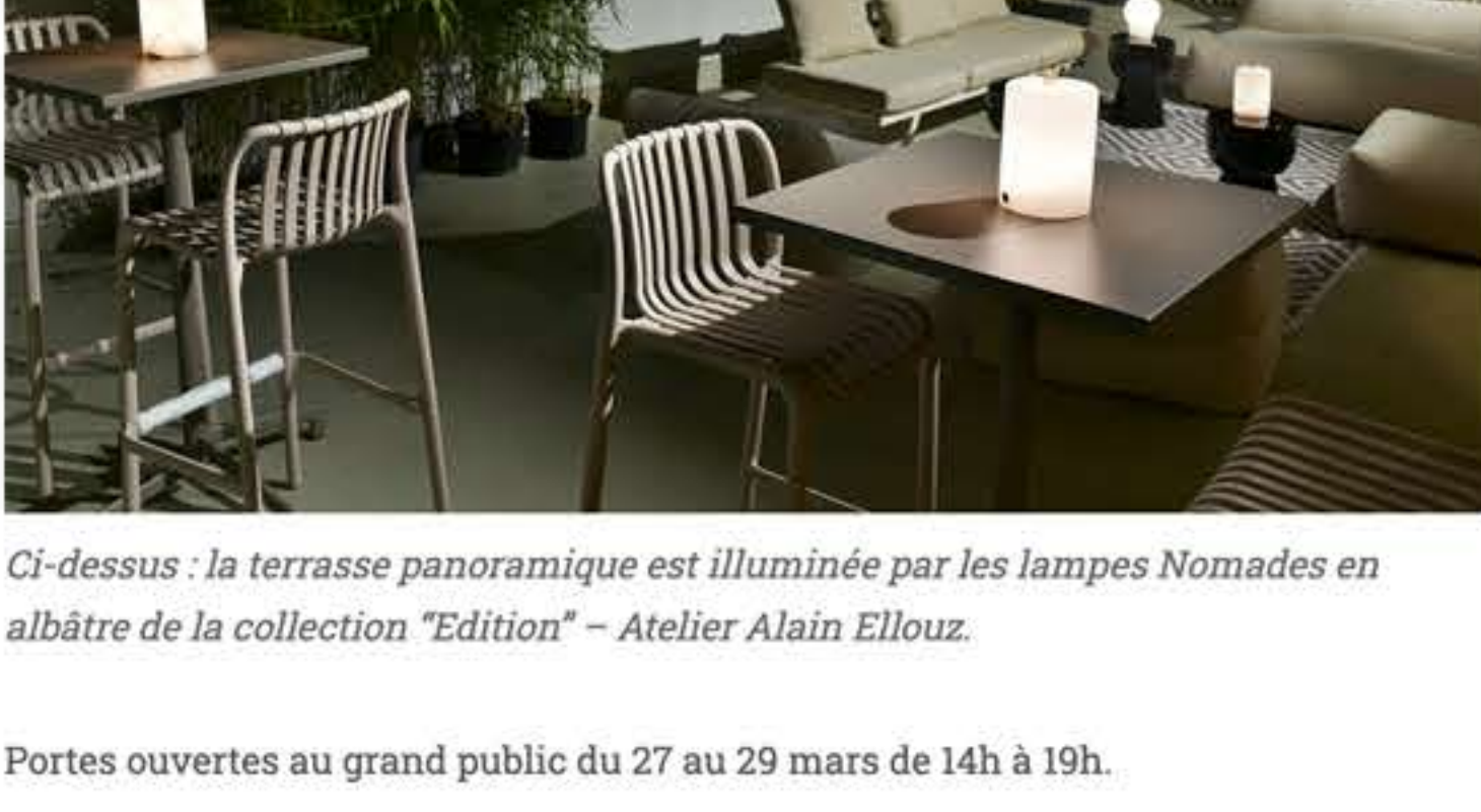
Ci-dessus : la terrasse panoramique est illuminée par les lampes Nomades en albâtre de la collection "Edition" – Atelier Alain Ellouz.

Portes ouvertes au grand public du 27 au 29 mars de 14h à 19h.